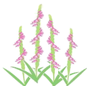
ネジバナ(花言葉 思慕)