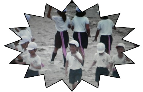
ジャングルの動物たちを 生き生きと表現できました