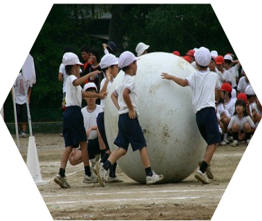
大玉に悪戦苦闘！ でもなかよくできました