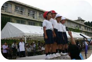
1年生が立派にあいさつしました