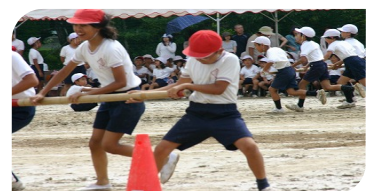
ぬかるみの中で 回るのは大変でした