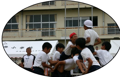
それぞれが必死で 力の限り、戦いました