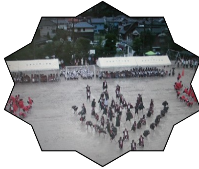
きびきびした動きと 力強い演技が印象的でした