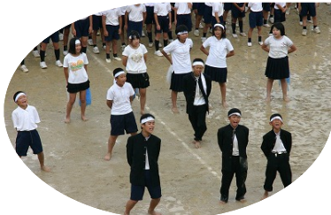
本当に大きな声を出し、みんなが心を一つにして 懸命に応援しました